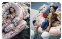
4F-《異質生成—共構視覺場》 (Heterogeneous Generations—Co-Constructed Fields of Vision)