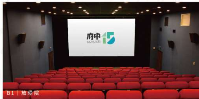
B1 | 放映院