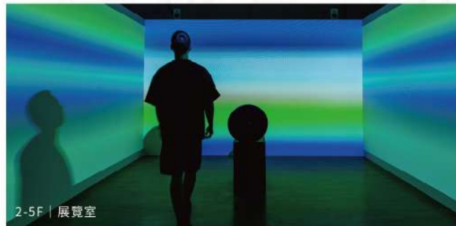
2-5F | 展覽室