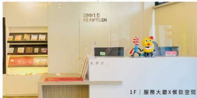
1F | 服務大廳X餐飲空間

府中15以推廣動態影像藝術(Moving Image)為宗旨, 包括電影、紀錄片、動畫、實驗影像等, 運用新科技、新媒體開發影視音藝術體驗的各種可能性, 增加人與人之間的感動, 並培育大眾認識影像製作的原理與過程及影像敘事的能力, 讓府中15成為影像藝術創新實驗及互動體驗推廣基地。