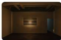
5F-《This is That》