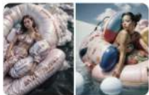
4F-《異質生成—共構視覺場》