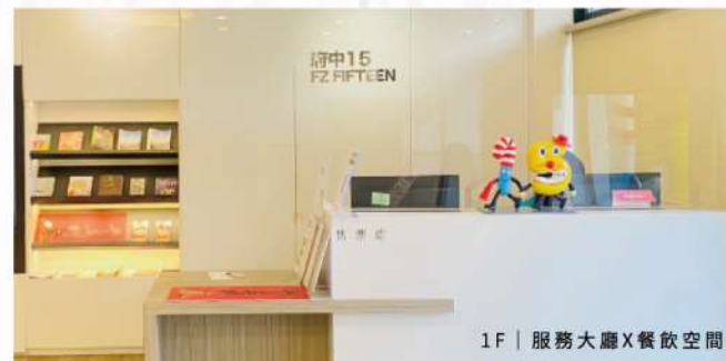
1F | 服務大廳 X 餐飲空間

府中15以推廣動態影像藝術(Moving Image)為宗旨，包括電影、紀錄片、動畫、實驗影像等，運用新科技、新媒體開發影視音藝術體驗的各種可能性，增加人與人之間的感動，並培育大眾認識影像製作的原理與過程及影像敘事的能力，讓府中15成為影像藝術創新實驗及互動體驗推廣基地。