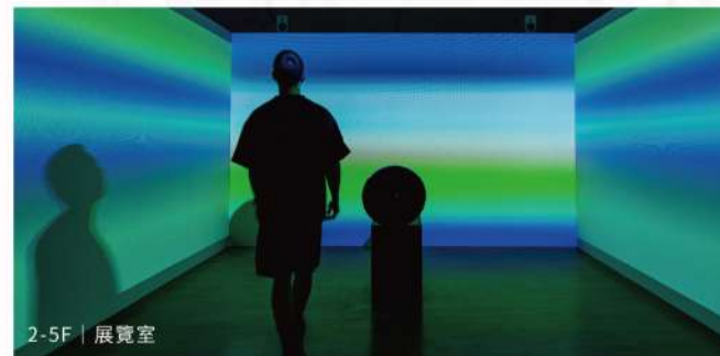
2-5F | 展覽室