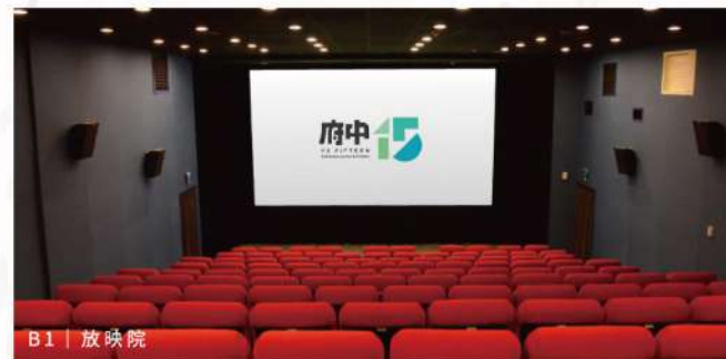
B1 | 放映院