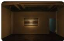
5F-《This is That》