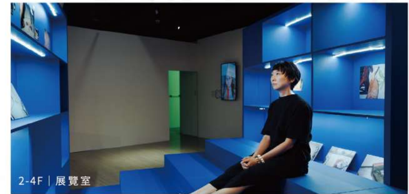
2-4F | 展覽室