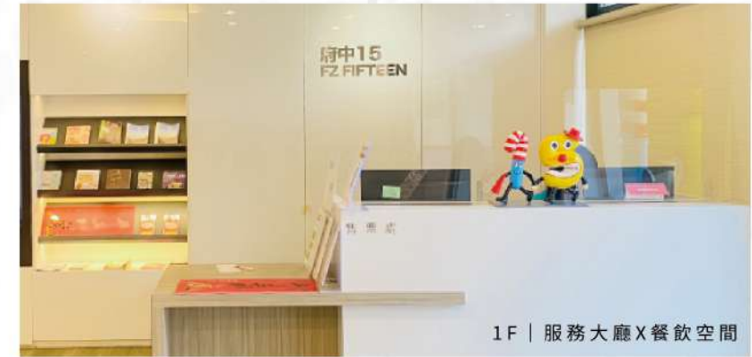
1F | 服務大廳X餐飲空間

府中15以推廣動態影像藝術(Moving Image)為宗旨，包括電影、紀錄片、動畫、實驗影像等，運用新科技、新媒體開發影視音藝術體驗的各種可能性，增加人與人之間的感動，並培育大眾認識影像製作的原理與過程及影像敘事的能力，讓府中15成為影像藝術創新實驗及互動體驗推廣基地。