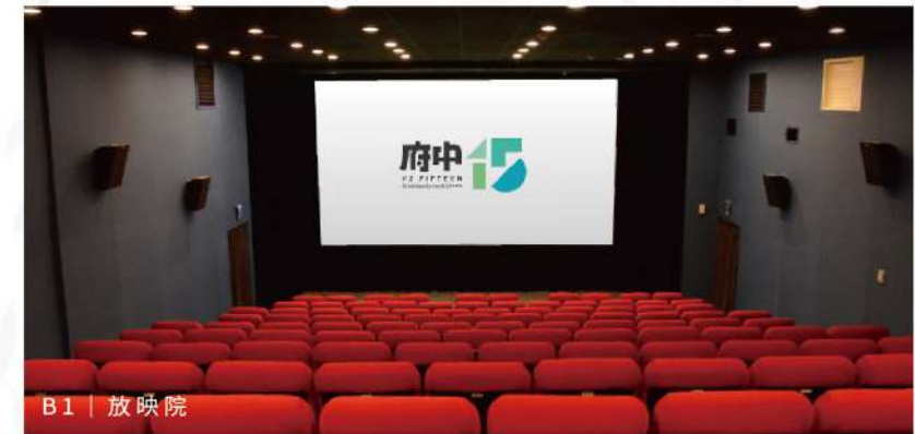
B1 | 放映院